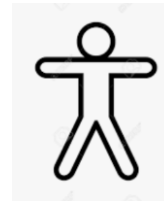
🚧 GELEIDER 🚧